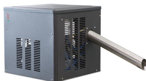
E-Cool Wall S Eisauswurf seitlich