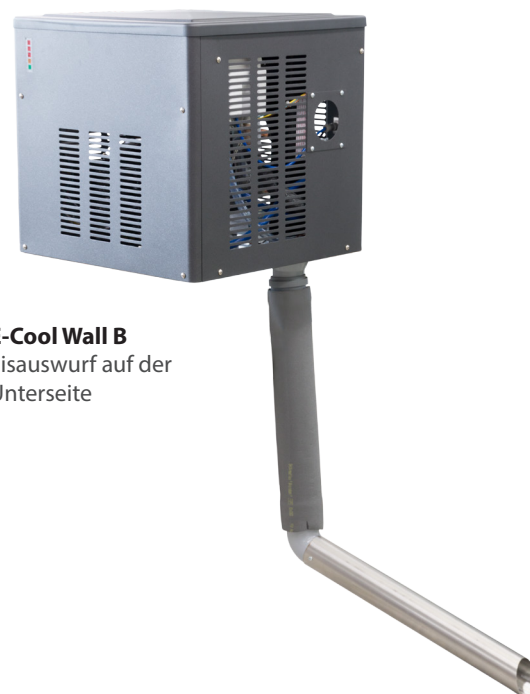
E-Cool Wall B Eisauswurf auf der Unterseite