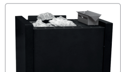
Auch erhältlich mit hochwertiger Beschichtung in Schwarz Matt.