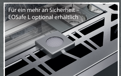
Für ein mehr an Sicherheit – EOSafe L optional erhältlich