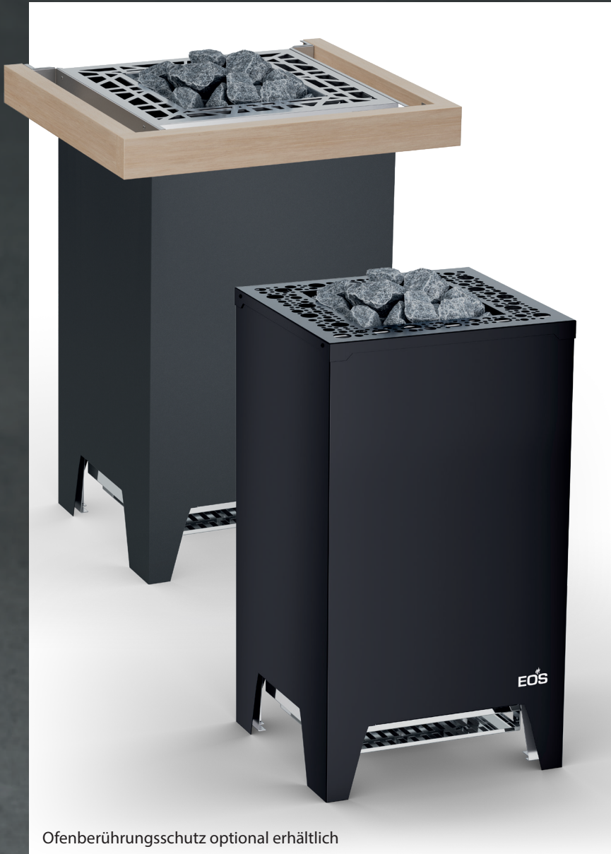
Ofenberührungsschutz optional erhältlich

4 JAHRE Garantie auf Heizstäbe bei privater Saunanutzung*