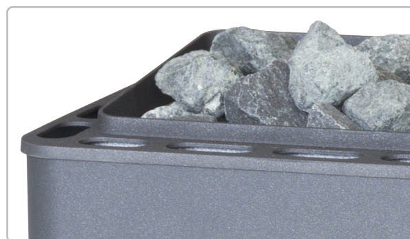
Präzise passend - hochwertige Alu-Druckgussabdeckung