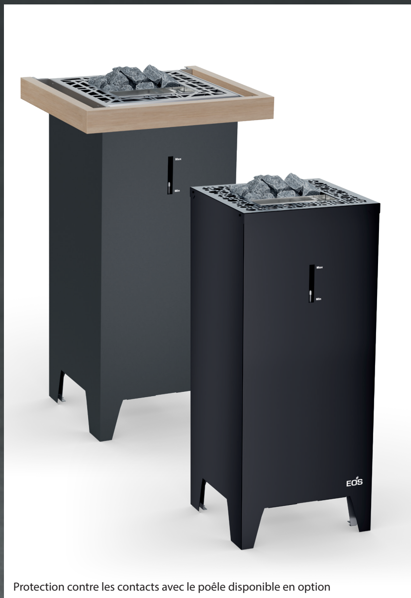
Protection contre les contacts avec le poêle disponible en option

de garantie sur les éléments chauffants en cas d'utilisation privée*