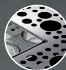
Styling 1 – Trou rond