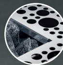
Styling 1 – Trou rond